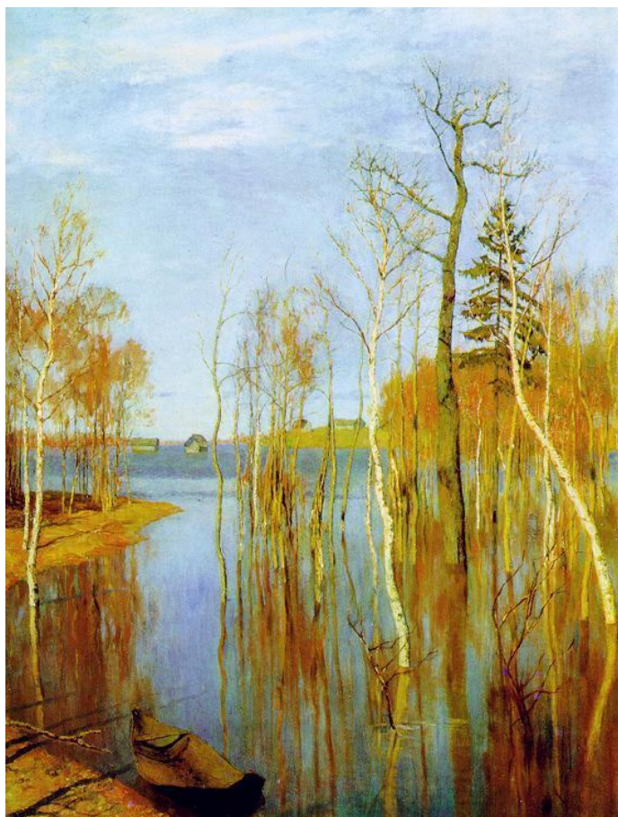
И. Левитан « Весна. Большая вода»

Воспитатель: Весна.... Это время года любили не только поэты, но и художники. Вспомните вот эти картины. Что на них нарисовано?